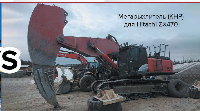
Мегарыхлитель (КНР) для Hitachi ZX470