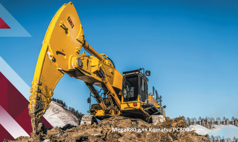
MegaR80 для Komatsu PC800

Компания «Профессионал» - ЛИДЕР российского рынка по продажам Мегарыхлителей в 2023 г. (реализовано более 150 шт.)