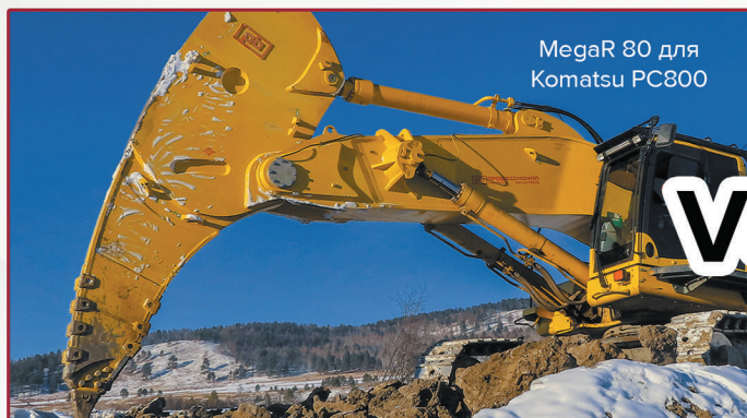
MegaR 80 для Komatsu PC800